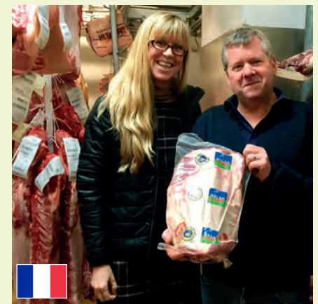
Boucherie Backing Cefnogi Cigyddiaeth