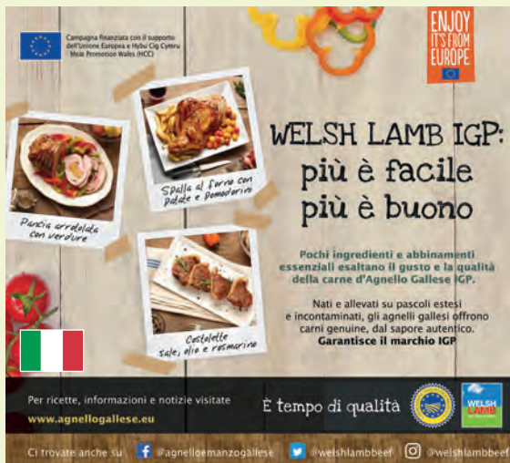
New promotions in Italy Hyrwyddiadau newydd yn yr Eidal

The drive is on to keep, expand and discover global markets for HCC as the industry prepares for life post-Brexit – aided by vital extra Welsh Government funding for an enhanced export programme.