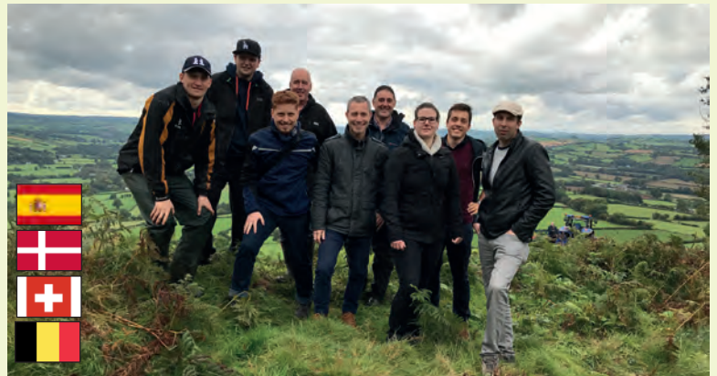
Showcasing Welsh farmers' production standards Arddangos dulliau cynhyrchu ffermwrwyr Cymru