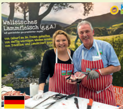
Foodservice Campaign Ymgyrch Arlwyo

Wrth i'r diwydiant baratoi ar gyfer bywyd ar ôl Brexit, mae ymgyrch HCC yn mynd rhagddo i gadw, ehangu a chanfod marchnadoedd yn fyd-eang. Gwneir hyn â chymorth arian ychwanegol hollbwysig gan Lywodraeth Cymru i gynyddu allforion.