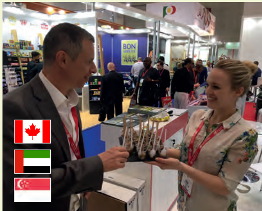
Major trade fairs with Welsh processors Ffeiriau masnach pwysig gyda phroseswyr o Gymru