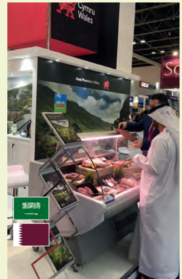
Opening Middle East trade Agor marchnadoedd newydd yn y Dwyrain Canol